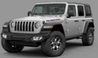
Billet Silver Metallic