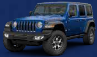
Ocean Blue Metallic