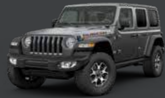
Granite Crystal Metallic